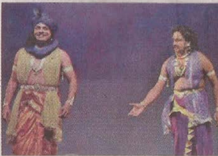
ಹನುಮಂತನಗರದ ಕೆ.ಎಚ್.ಕಲಾಸೌಧದಲ್ಲಿ ಸಂಧ್ಯಾ ಕಲಾವಿದರು ಹವ್ಯಾಸ ನಾಟಕ ತಂಡದ ವತಿಯಿಂದ 'ಸುಯೋಧನ' ನಾಟಕ ಪ್ರದರ್ಶನ. ರಾತ್ರಿ 7.30

ತಾವರೆಕೆರೆ, ಮುದ್ದಯ್ಯನವಾಳ್ಕೆ, ಶ್ರೀ ಆಂಜನೇಯ ಸ್ವಾಮಿ ದೇವಾಲಯದ ಆವರಣ, ರಂಗಪರಂಪರೆ ಟ್ರಸ್ಟ್ ವತಿಯಿಂದ 'ರಂಗಪರಂಪರೋತ್ಸವ' ಅಂಗವಾಗಿ ಹಾಸ್ಯ ನಾಟಕ ಪ್ರದರ್ಶನ, ಜಾನಪದ ನೃತ್ಯ, ಕೋಲಾಟ, ಪೂಜಾ ಕುಣಿತ, ಉಪನ್ಯಾಸ ಮತ್ತು ರಂಗೀತ ಕಾರ್ಯಕ್ರಮಗಳು. ಸಂಜೆ 5.30