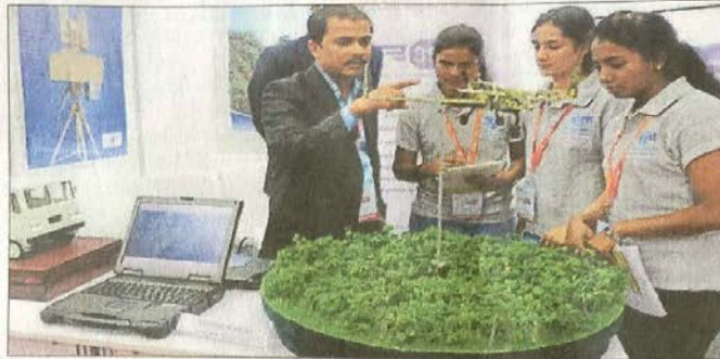
A startup founder explains a product to students at the 'ICT & IoT Start-up Tech Expo' in Bengaluru on Saturday.