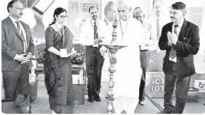
జ్యోతి వెలిగిస్తున్న కేంద్ర మంత్రి మనోజ్ సిన్హా