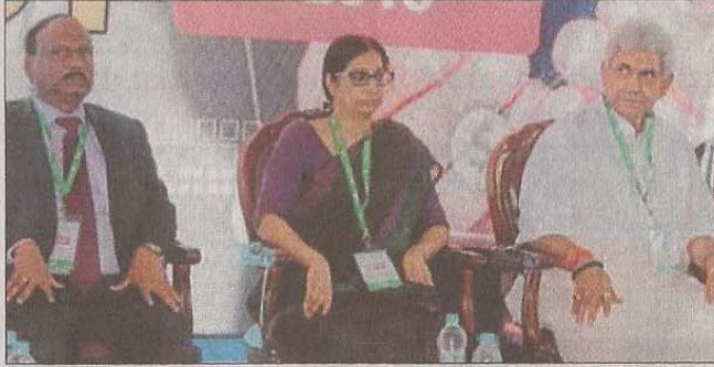
ಕಾರ್ಯಕ್ರಮದಲ್ಲಿ ಕೇಂದ್ರ ಸಂವಹನ ಸಚಿವ ಮನೋಜ್ ಸಿನ್ಹಾ (ಬಲತುದಿ) ಇದ್ದರು

ಐಸಿಟಿ ಮತ್ತು ಐಒಟಿ ಸ್ವಾರ್ಥ ಅಪ್ ಟೆಕ್ ಎಕ್ಸ್‌ಪೋ ಪ್ರದರ್ಶನದಲ್ಲಿ ಕೇಂದ್ರ ಸಂವಹನ ಮತ್ತು ರೈಲ್ವೆ ಖಾತೆ ರಾಜ್ಯ